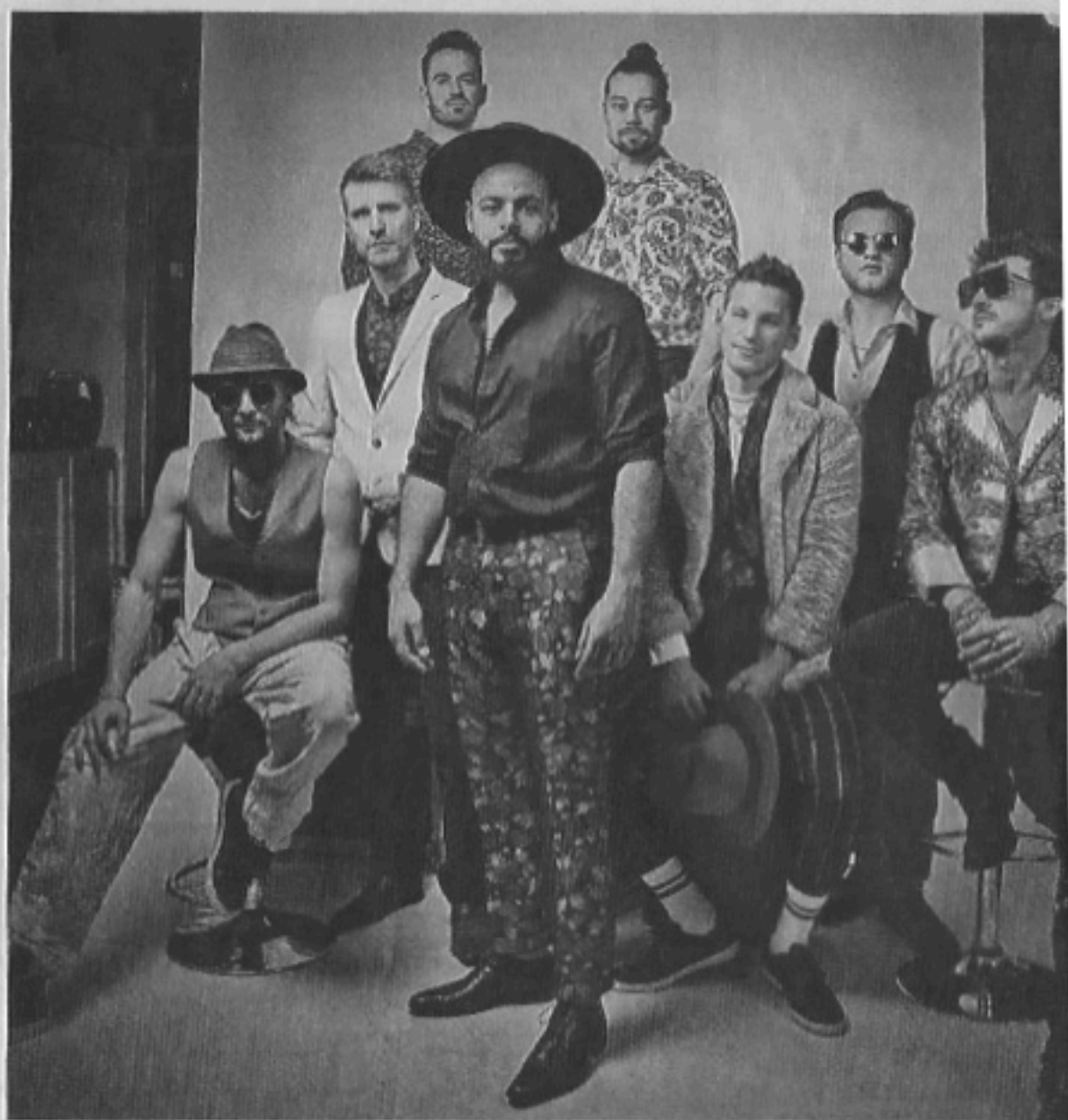
Die Freiburger Band FatCat war schon letztes Jahr für MIA eingepplant, 2021 soll es nun klappen.